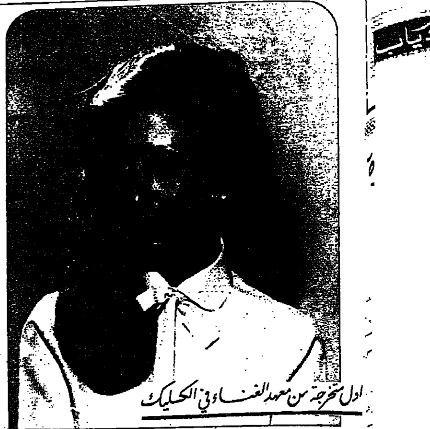
اول تخرج من معهد الفناء وفي الكليك

ما احل ليلي الريف ما احلامها كما يسالي تمر فكرها فيها المواسم واطل فيها الجمال والفن والابداع من معجم زواياها الفن عنا ميعسو انغام وزجيج والخير عنا ميعو قلال وسيل عنا « هداة البابل »، اغلي من الكوز عنا المحبة الصادق نوراً اكمل وع دبكة الشبان وزغردة الشبان والناي الحنون يزيد سرورنا لهباب الحادي بشعرو يجهود ورفيقو مسو يحاوروا الفن من معنى وعقاب وع دبكة الشبان وزغردة الحسان « وفنجان سادة » يدور ع اطراف النديوان ولما الفوارس تعقل ظهور الخيول كاسود تحمي اشبالها ان جاز الزمان